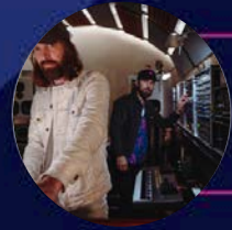
Breakbot & Irfante