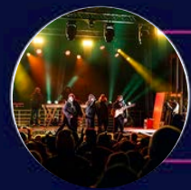
Et bien d'autres...